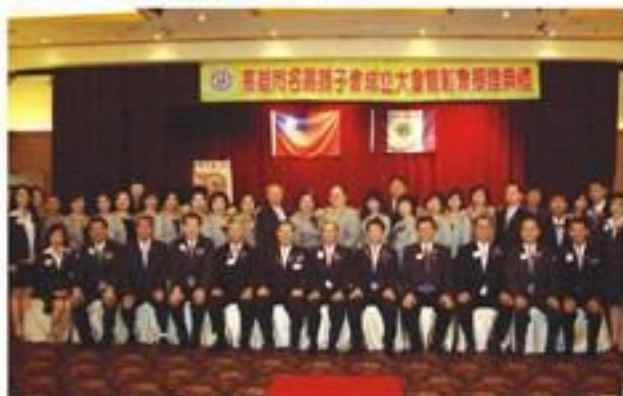
8月6日假福華大飯店舉行成立大會暨創會授證典禮。