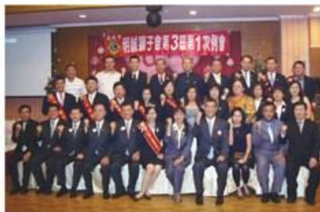
7月30日假前鎮鳳姊餐廳舉行第3屆第1次例會暨會職幹部就職典禮。