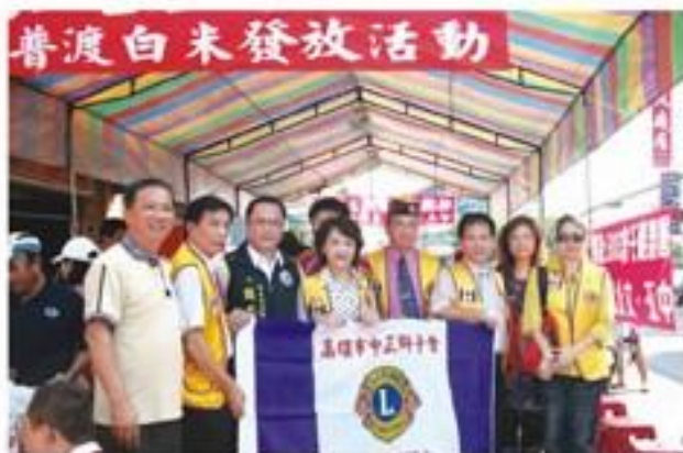
配合分區於8月21日假林園區三聖宮廟前舉辦捐助林園區低收入戶贈白米及食品之社會服務。