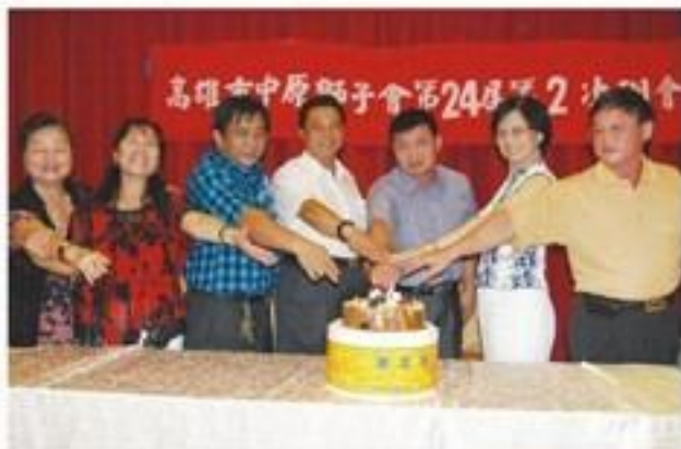
8月21日假躍龍港式餐廳舉行第二次例會暨慶生會