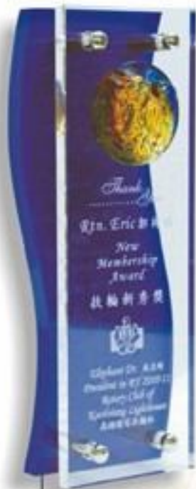
雙層壓克力琉璃獎座