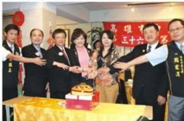
7月11日假八大餐廳舉行本會36屆第一次例會