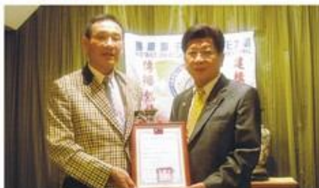
黃專區主席代表社會局頒發理事長當選證書。