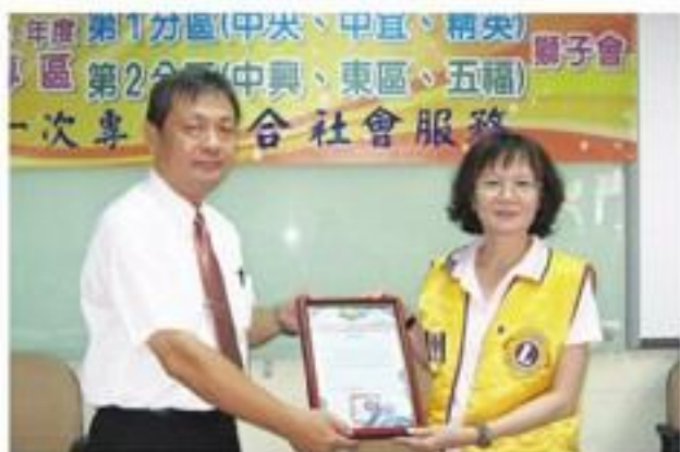
配合專區舉辦「捐贈高雄市啟智學校學生助學金」活動。