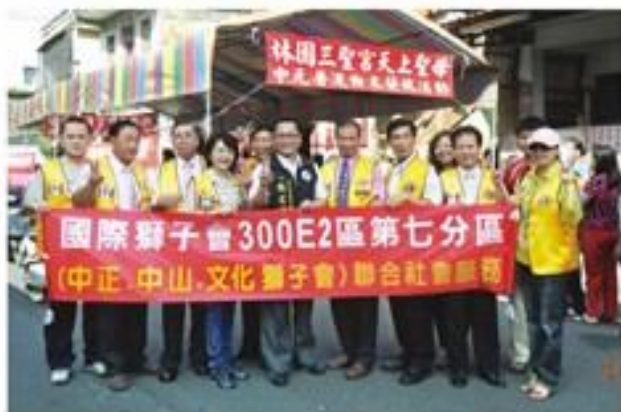
8月21日配合所屬第七分區假林園三聖宮配合慶讚中元舉辦賑濟低收入戶米包發放活動。