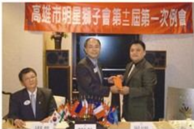
莊第一副總裁明昇致贈社會服務基金。