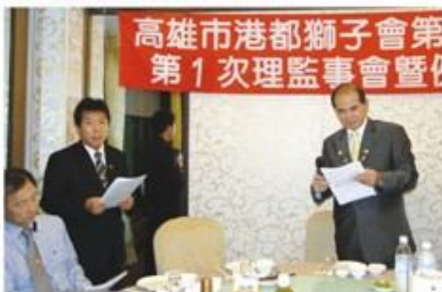
7月17日假真實海鮮餐廳舉行第26屆第一次理監事暨例會。