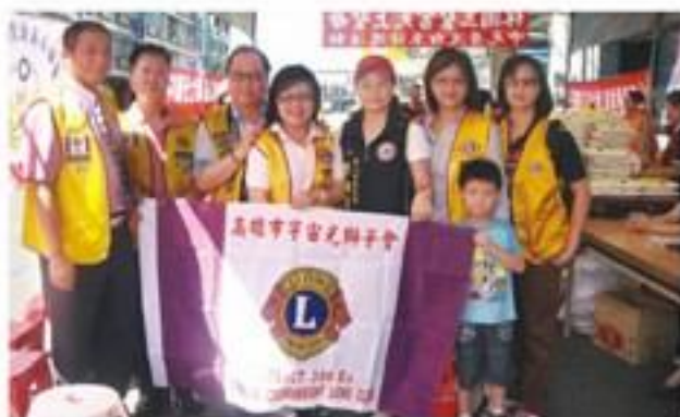
第八分區聯合社會服務。