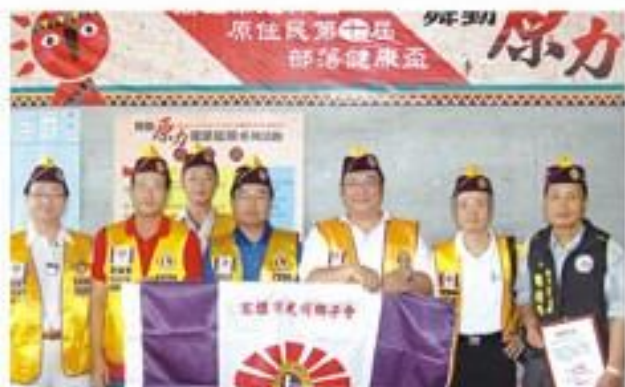
參加「高雄市原住民區第七屆部落健康盃暨第三屆銀髮盃運動會」社會服務。