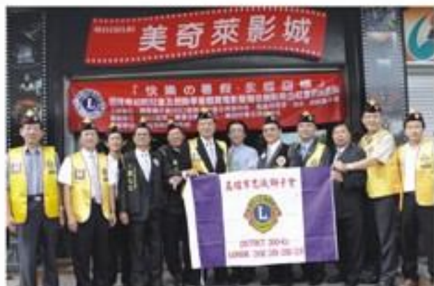
8月12日參與所屬第三分區~舉辦招待清寒弱勢學童「快樂的暑假電影欣賞」活動。