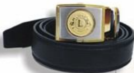
高纖維無穿孔皮帶 (MARK可更換)