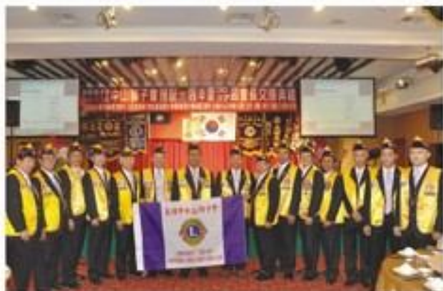
7月3日假竹山國小參加兄弟會竹山獅子會授證典禮。