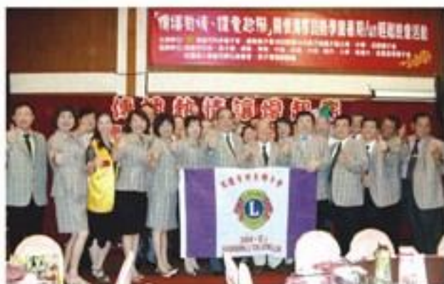
8月28日舉辦「傳播熱情、讓愛起飛」關懷清寒弱勢學童暑假放輕鬆晚會。