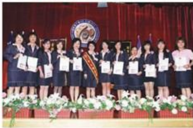
▲ 7月17日假福華大飯店福華廳召開第1次理監事會／例會暨新任會職員就職典禮。