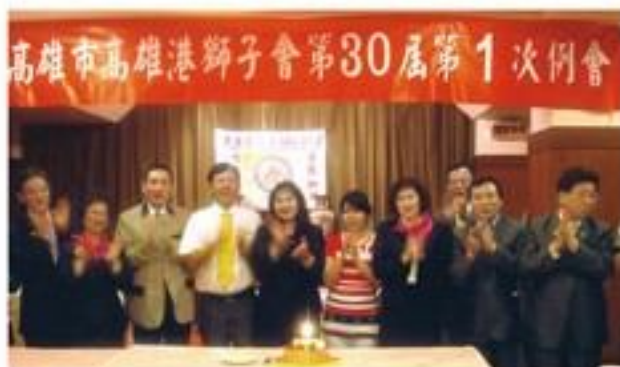
7月2日假真實餐廳舉行第30屆第1次例會並慶生。