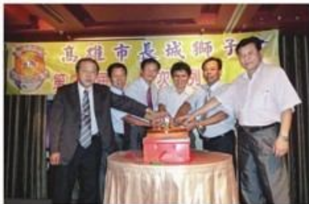
8月26日假華漾大飯店舉辦八月份例會暨慶生會