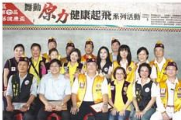
7月28日前往茂林區茂林里綜合籃球場，舉辦「高雄市原住民區第七屆部落健康盃暨第三屆銀髮盃」運動會。