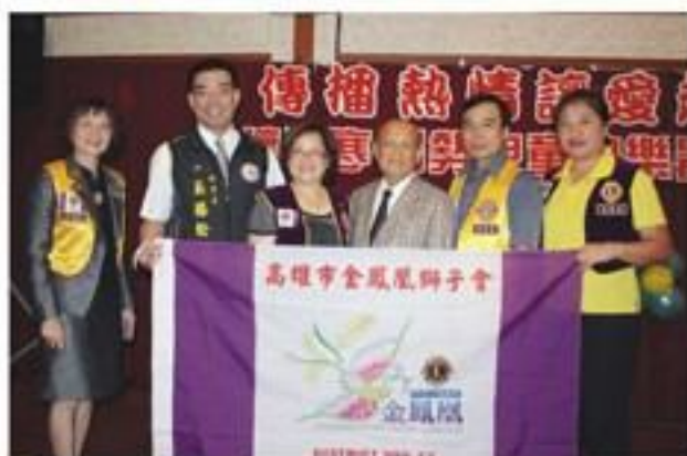
8月28日配合利多獅子會舉辦「傳播熱情、讓愛起飛」關懷清寒弱勢兒童暑期fun輕鬆晚會活動。