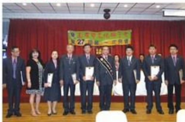
7月22日假躍龍海鮮餐廳舉行第27屆會長暨幹部就職。