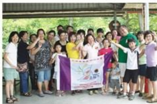
8月20日假憶童年休閒農場舉辦親子戶外烤肉活動