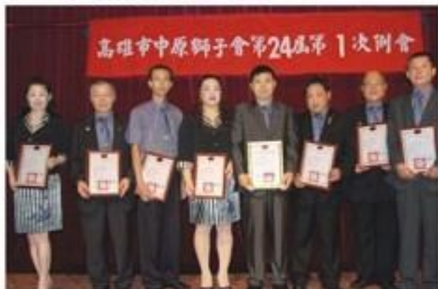
7月24日假寒軒大飯店舉行第一次例會暨理監事會職員就職典禮。