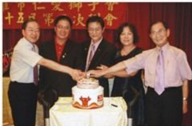
8月24日舉行第35屆第二次例會暨八月份獅兄、獅嫂生日慶生會。