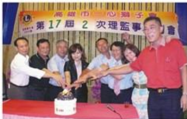
8月16日假秀桑燒烤名店召開本會第16屆第2次理監事及例會。