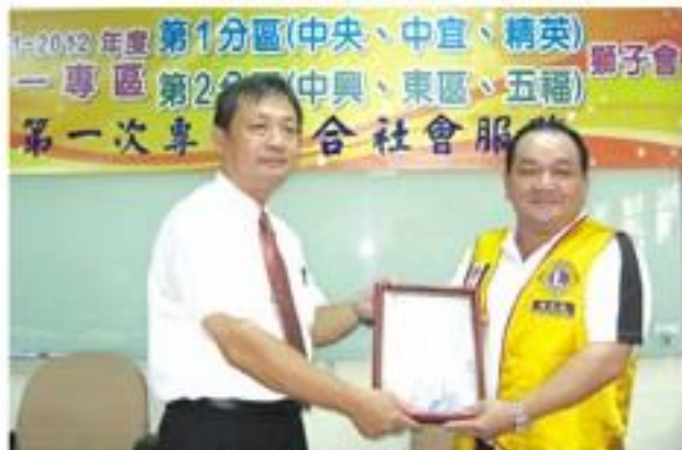
配合專區舉辦「捐贈高雄市啟智學校學生助學金」活動。