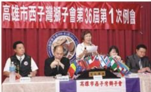
7月3日假躍龍餐廳召開第1次例會暨新任會職員就職典禮。