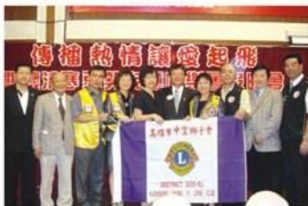
8月28日配合利多獅子會舉辦「傳播熱情、讓愛起飛」關懷清寒弱勢學童暑假放輕鬆晚會。