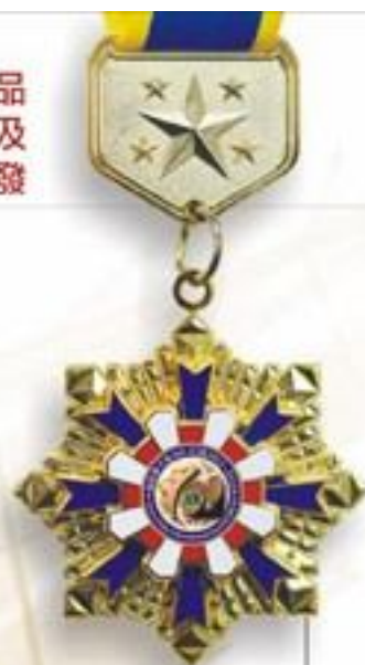
各式客製化證章、監章