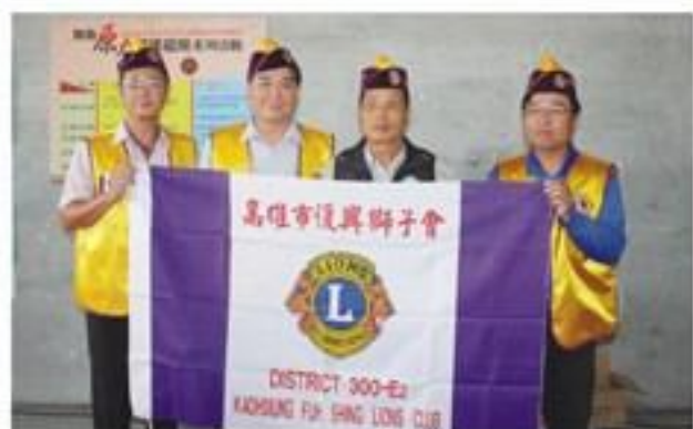
7月28日配合所屬分區前往茂林區舉辦「高雄市原住民第七屆部落健康盃暨第三屆銀髮盃運動會」。