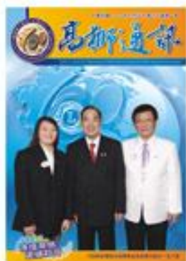
(封面圖片) 總裁與國際總會會長合照

發行者／國際獅子會300-E2區 會址／高雄市民生一路271號2樓 電話／(07)272-9197-8 傳真／(07)272-9269 E-mail／e30012.lions@msa.hinet.net 網址／www.300e2.org.tw 印刷／好印象包裝設計印刷公司 07-7613066