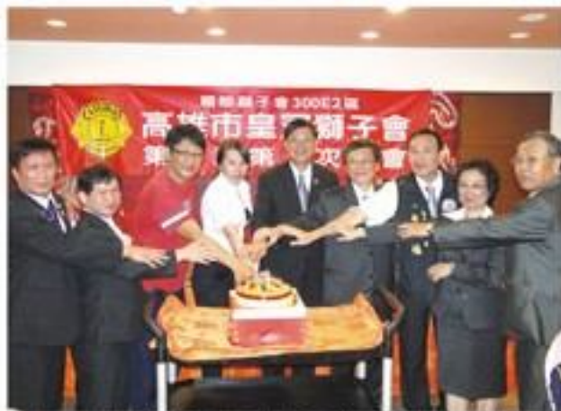
7月16日假祥鈺樓餐廳舉行第5屆第一次例會並慶生。