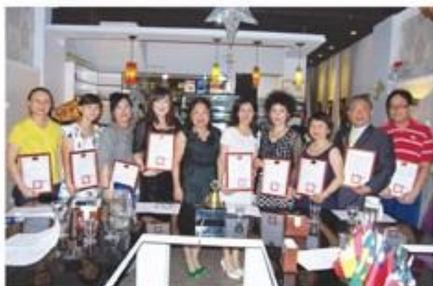
8月23日假法喜妮餐廳舉行第二次月例會暨頒發理監事當選証書。