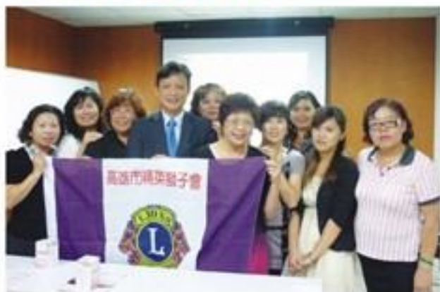
舉辦健康檢查義診。