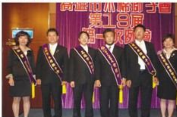
7月17日舉行第19屆第一次例會暨職員就職典禮