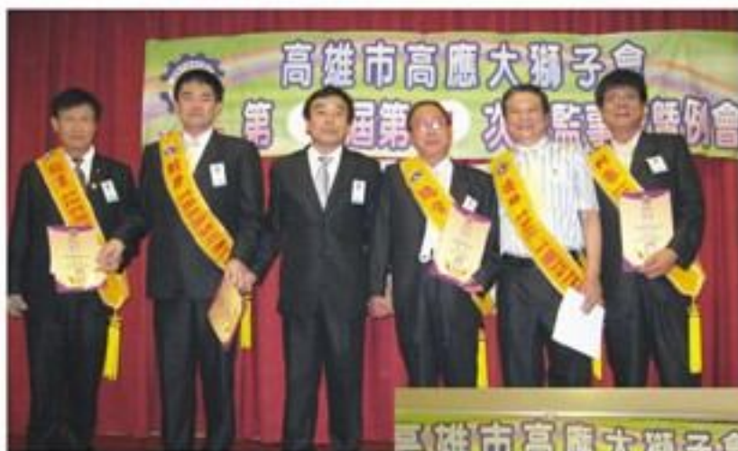
◀ 頒發第7屆幹部聘書 並披掛彩帶。