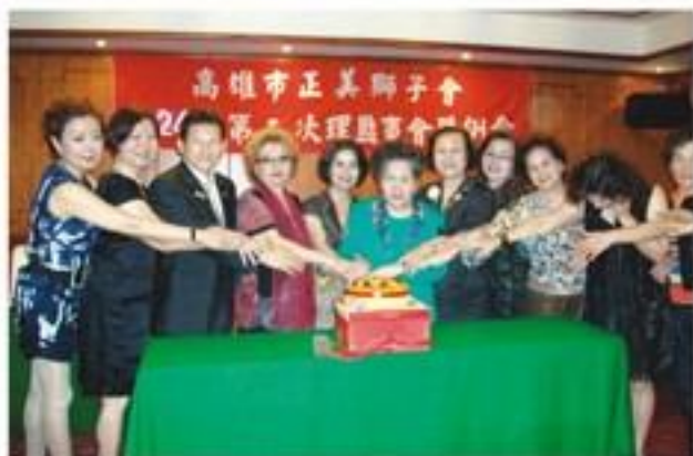
8月9日假福華大飯店召開8月份理監事會暨例會