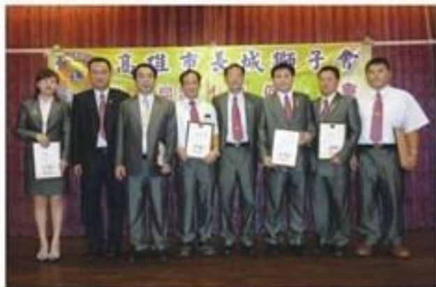
7月22日假真實餐廳舉行第31屆第1次例會暨理監事會職員就職。