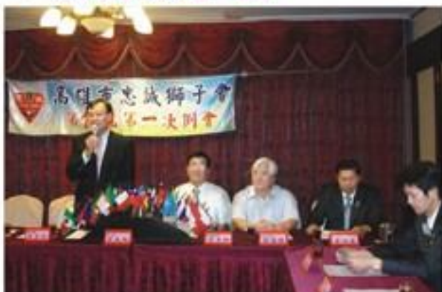
7月27日假真實餐廳舉行18屆第一次例會。