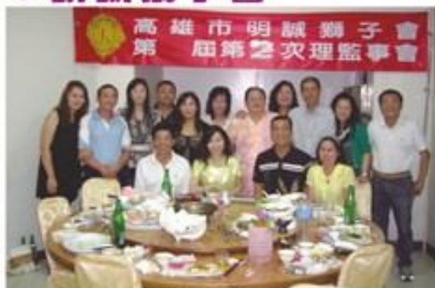
8月21日假湖邊海產餐廳召開第3屆第2次理監事會暨例會。