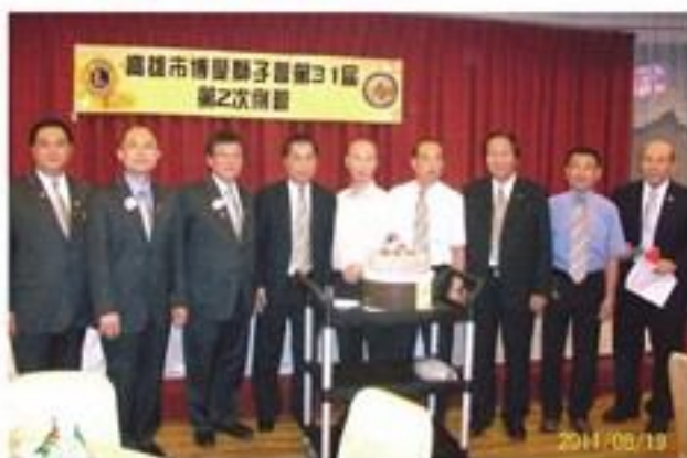
總裁率內閣來訪與7、8月壽星慶生合照。