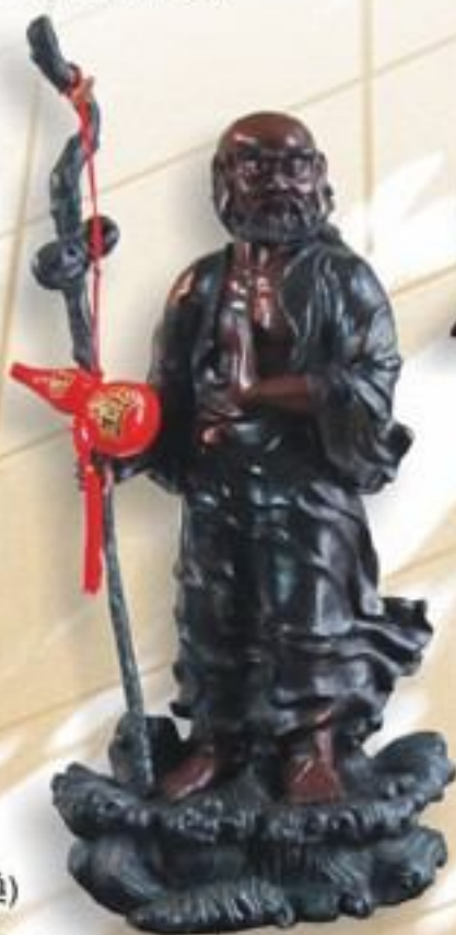
銅雕 / 達摩祖師