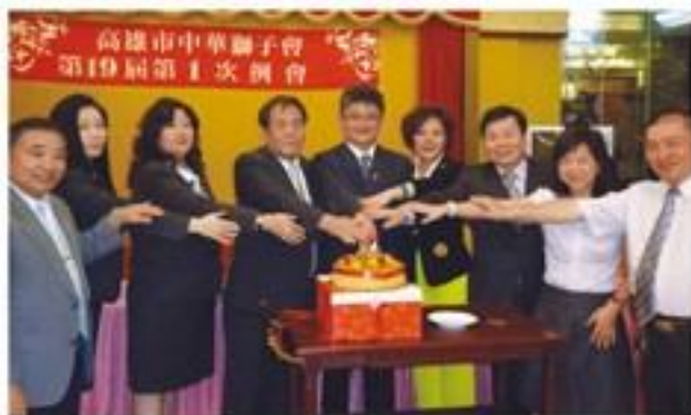
7月27日假品頂101餐廳舉行本會第一次例會暨慶生會。