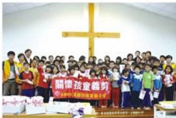
舉辦關懷兒童義剪。