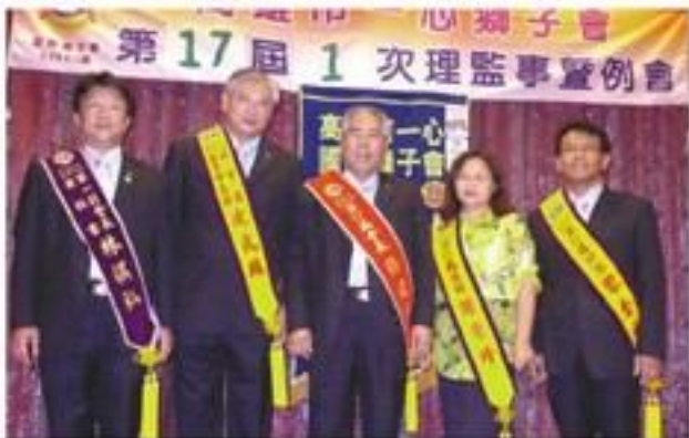
7月24日假真實餐廳2樓舉辦本會第17屆第1次理監事及例會暨幹部就職典禮活動。