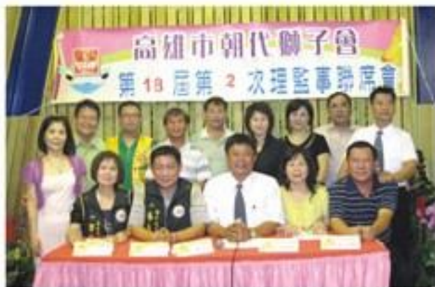
8月11日假秀桑燒烤店召開第18屆第2次理監事會