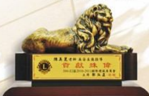
祥獅獻瑞 / 臥獅