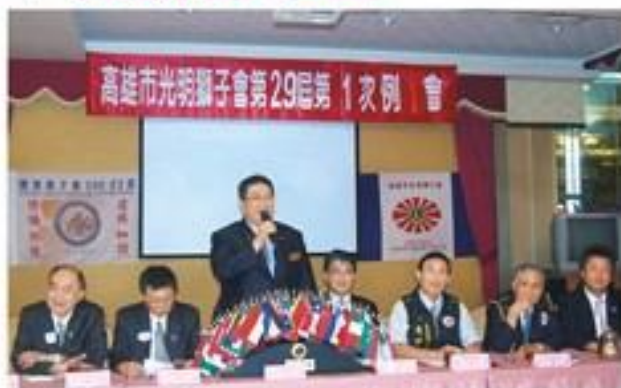
第29屆第1次例會邀請王總裁、區成員、母子孫會蒞臨參加。