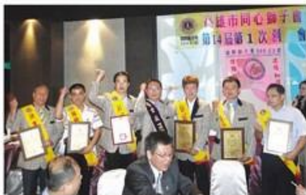
7月29日假蕭子樹蔬活靈宴會館舉行第14屆會長暨幹部就職。