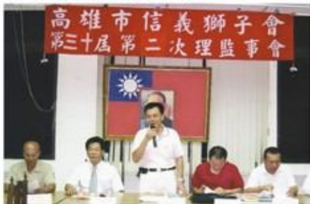
8月9日本會第二次理監事會。