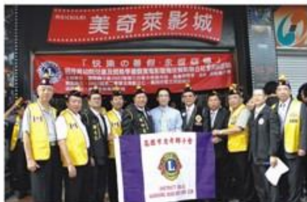
參與所屬第三分區~舉辦招待大高雄地區清寒弱勢學童「快樂的暑假電影欣賞」活動。