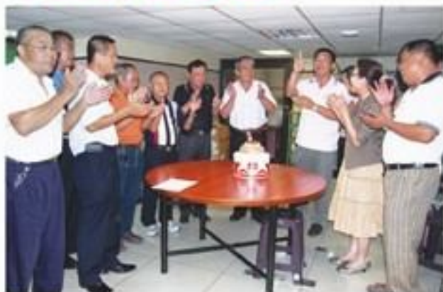
8月11日假獅子會館舉行第二次例會暨慶生會。