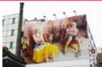
戶外大圖輸出施工