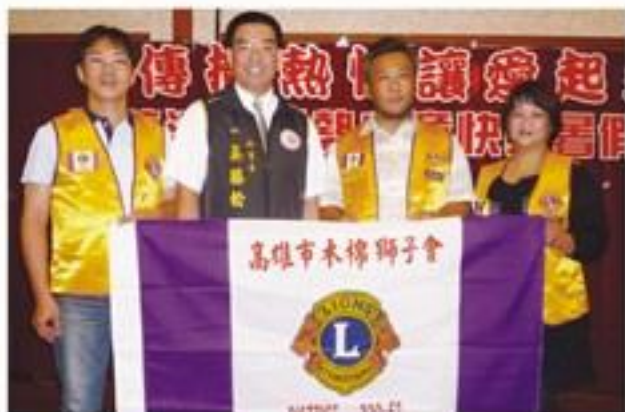
8月28日假西子灣餐廳贊助舉辦「傳播熱情、讓愛起飛」一招待300位弱勢學童快樂晚餐。