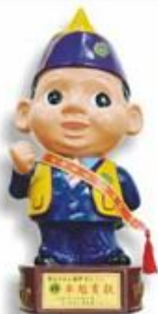
獅子會公仔 / 男