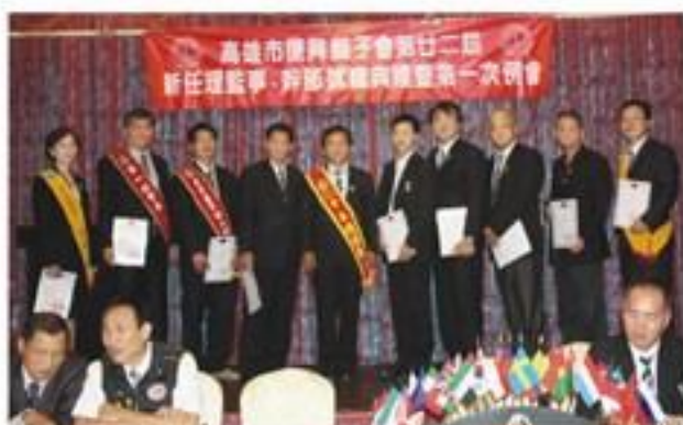
7月27日假真實餐廳舉辦本會第22屆第一次例會暨幹部理監事就職儀式。