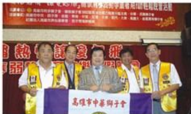
8月28日假西子灣餐廳配合第14分區聯合舉辦「關懷清寒弱勢學童快樂暑假晚會」社會服務。