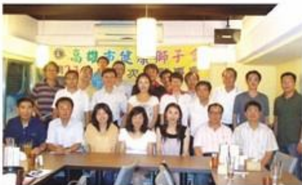
7月14日假公主巧廚餐廳召開第23屆第1次理監事會。