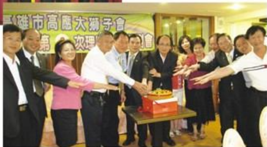
8月17日假西子灣餐廳 ▶ 召開第7屆第2次理監事會 暨例會。