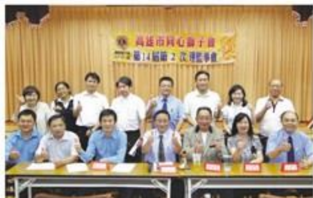
7月28日前往茂林鄉聯合舉辦高雄市茂林原住民區部落健康盃「舞動原力、健康起飛」活動。