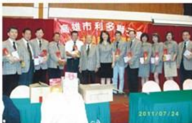
7月24日假西子灣餐廳舉行本會第10屆第一次例會。