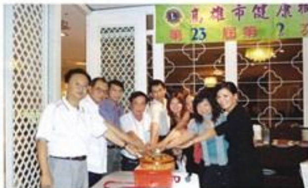
8月25日假紅豆食府餐廳舉辦八月份例會暨慶生會。