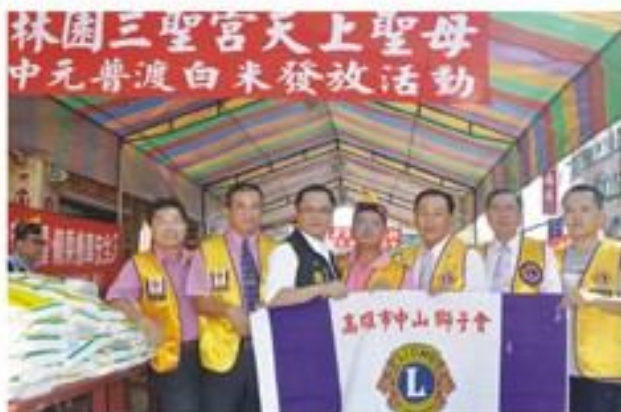
8月21日假高雄市林園區三聖宮賑災配合第7分區舉辦「低收入戶米包發放」社會服務。