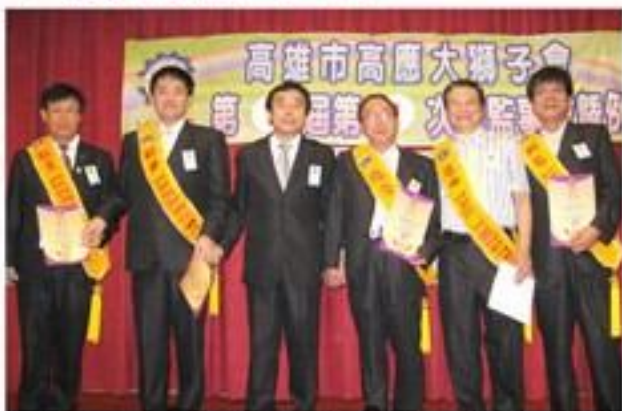
7月12日召開第7屆第1次理監事暨例會鄭會長為幹部配掛職務肩帶及頒發聘書。