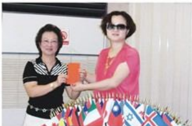
8月27日中午假躍龍餐廳舉行8月份例會。