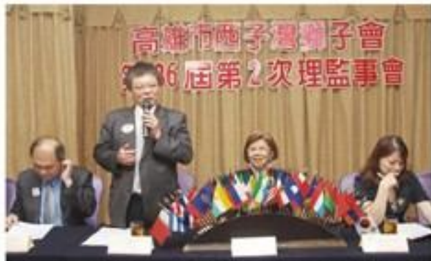
8月11日假漢來大飯店召開本屆第2次理監事會議