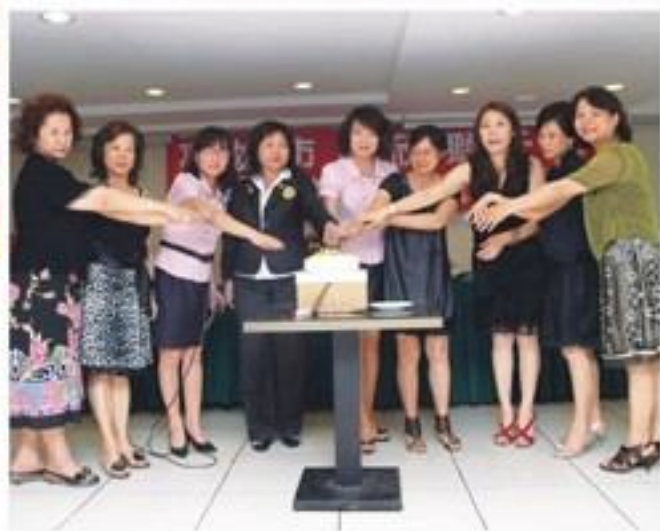
▼ 8月12日召開本屆第2次理監事會暨例會。