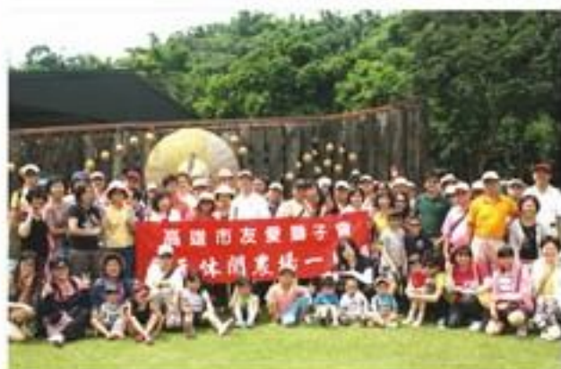
8月21日南元休閒農場一日遊。