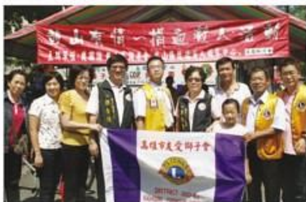
7月3日鼓山區內惟九如公園一捐血活動社會服務