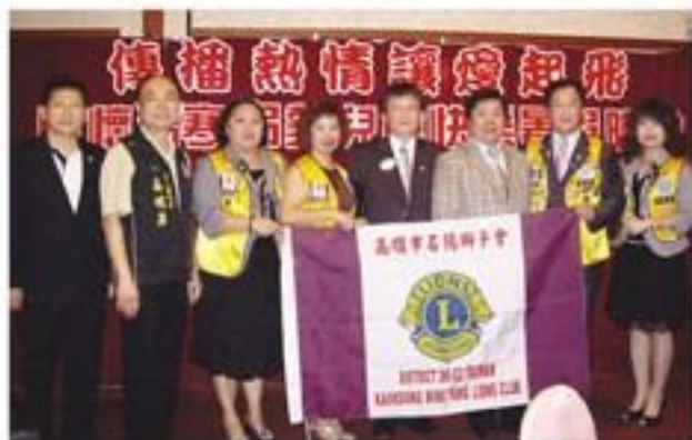
8月28日參加第14分區「傳播熱情、讓愛起飛」關懷清寒弱勢學童快樂放暑假活動。