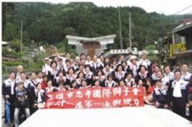
7月16~17前往阿里山、奮起湖舉辦31屆獅嫂日自強活動。