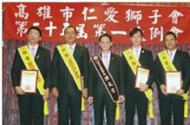
7月13日舉行第35屆第一次例會暨職員就職典禮