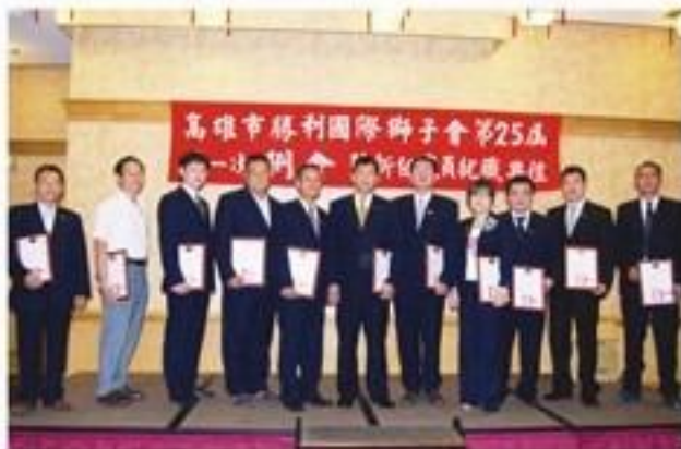
7月25日假福華大飯店舉行第一次例會暨理監事會職員就職典禮。